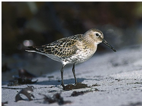
352 Myrsniipe. (Jan Rabben)

Mange av trekkfuglane må langt av garde for å finna høvelege vilkår når vinteren nærmar seg. Å flyga krev mykje energi. Ei and