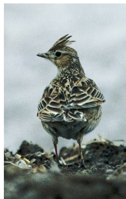
Songlerke. (Thor Østbye)

brukar fem gonger så mange kaloriar for kvar tidseining ho flyg, samanlikna med å ta seg roleg rundt på land. Fuglane blir nok slitne av å flyga langt, men vel så viktig er det at dei ikkje går tomme for «drivstoff». Før det lange trekket tek til, går dei fleste gjennom ein feitekur. Opplagra feittreservar på kroppen er «flybensin». Tek dette lageret slutt, er krisa eit faktum, om det ikkje finst ei naudhamn innan rekkjevidd.